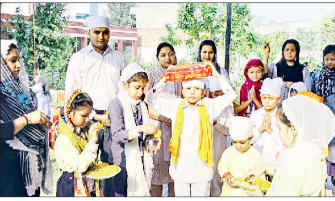
उपकार हाई स्कूल में प्रकाशोत्सव पर अरदास करते बच्चे व शिक्षक।

हरिभूमि न्यूज़ रोहतक हरियाणा सिख गुरुद्वारा प्रबंधक कमेटी की धर्म प्रचार कमेटी तथा क्षेत्र की संगत के सहयोग से जगत गुरु श्री गुरु नानक देव का 556वां प्रकाश पर्व ऐतिहासिक गुरुद्वारा बांगला साहिब में अत्यंत श्रद्धा, भक्ति और उल्लास के साथ मनाया गया।