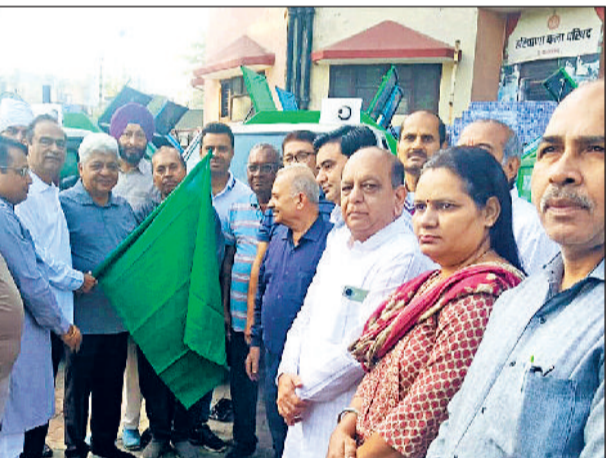
रोहतक। वार्ड 14 में गाड़ियों को हरी झंडी दिखाकर रवाना करते हुए मुख्य अतिथि एवं अन्य।

गाड़ी घर से कूड़ा उठाएगी तो उस घर पर लगे टैग को स्कैन किया जाएगा, जिससे सरलता से ज्ञात किया जा सकेगा कि घर से कूड़ा उठाया गया है या नहीं। इससे व्यवस्था में पारदर्शिता आएगी और जवाबदेही तय होगी।