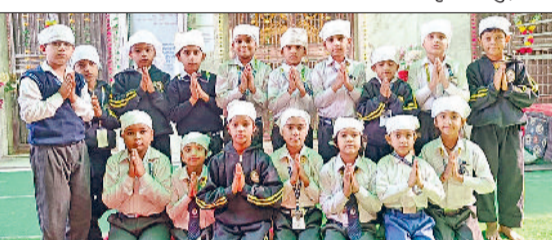
महम। लाखन माजरा के गुरुद्वारा मंजी साहिब में नमन करते एचडी स्कूल के विद्यार्थी।