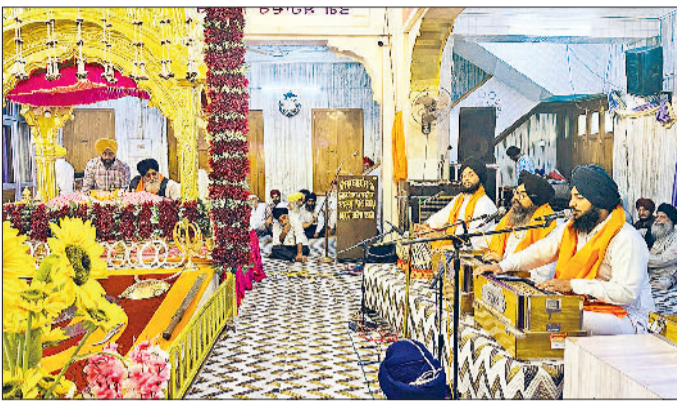
गुरुद्वारा बांगला साहिब में शबद कीर्तन करता जत्था व गुरु घर में लगे लंगर में प्रसाद पाती संगत।